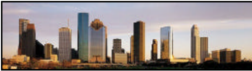
Horizonte de Houston